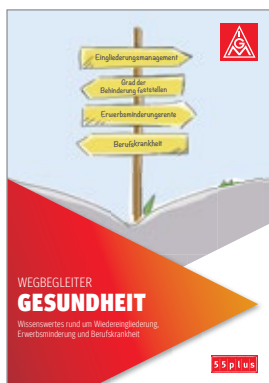
Broschüre DIN A4, Produkt-Nr. 40369-92404

Dieser Wegbegleiter bietet einen Überblick über zentrale Fragen des Arbeitslosengeldes: Wie hoch ist das Arbeitslosengeld I? Wie wird es beantragt und wie lange wird es gezahlt? Was ist ein zumutbares Arbeitsangebot und was nicht? Wann treten Sperrzeiten ein?