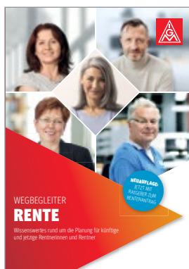
Broschüre DIN A4, Produkt-Nr. 40370-75285

Der Wegbegleiter bietet Informationen rund um das Thema Erwerbsminderungsrente und beantwortet Fragen zu Voraussetzungen, Antragsstellung, Fristen, Hinzuverdienst und vielem mehr.