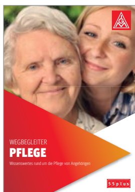
Broschüre DIN A4, Produkt-Nr. 47472-91207

Die IG Metall engagiert sich für sichere Arbeitsplätze, faire Löhne sowie eine gute soziale Absicherung. Sie unterstützt ihre Mitglieder bei Problemen in der Arbeitswelt, aber auch bei weitergehenden Fragen des Lebens. In der Wegbegleiter-Reihe werden Lebens- und Alltagsfragen wie Vorsorge, Rente, Gesundheit oder Pflege aufgegriffen. Die Themen werden übersichtlich aufgearbeitet und Orientierungshilfen gegeben.