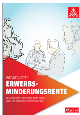
Broschüre DIN A4, Produkt-Nr. 45219-86534

Zentrale Fragen rund um Wiedereingliederung, Rehabilitation, Behinderung sowie Erwerbsminderung werden im Wegbegleiter Gesundheit erklärt und anhand von Beispielen verdeutlicht.