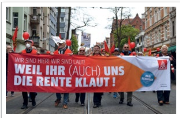
AGA Hannover auf der Demo zum 1. Mai 2022

Unter dem Dach der AGA Hannover läuft das Projekt „Metaller helfen Metallern“: Seit über zwölf Jahren unterstützen ehrenamtliche Kolleginnen und Kollegen dort erwerbslose Mitglieder bei der Suche nach einem neuen Arbeitsplatz. Sie helfen bei der Bewerbung, geben Tipps für Bewerbungsgespräche und nutzen ein umfassendes Netzwerk mit Betriebsräten und Vertrauensleuten, um Jobs zu vermitteln. Eine weitere Fachgruppe gibt es zum Thema Rente. Sie berät Mitglieder in wöchentlichen Sprechstunden zu allen Rentenfragen, organisiert Infoveranstaltungen und gestaltet zweimal im Jahr das Seminar „Hinter dem Horizont – geht’s weiter“ sowie Schulungen für Betriebsräte und Schwerbehindertenvertretungen. Vier Senior:innengruppen ergänzen das Angebot mit Freizeitaktivitäten in verschiedenen Teilen der Region.