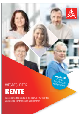
Broschüre DIN A4, Produkt-Nr. 40370-75285

Der Wegbegleiter bietet Informationen rund um das Thema Erwerbsminderungsrente und beantwortet Fragen zu Voraussetzungen, Antragsstellung, Fristen, Hinzuverdienst und vielem mehr.