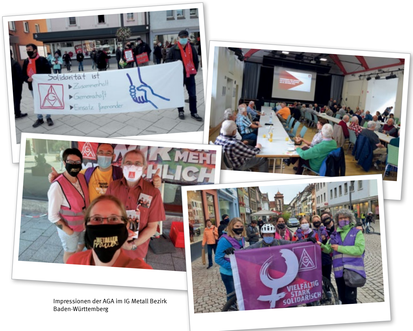
Impressionen der AGA im IG Metall Bezirk Baden-Württemberg

felder aktiv mit. Sie greifen Probleme auf, die im Alltag der Senior:innen bestehen und entwickeln auf regionaler Ebene Lösungsansätze dafür.