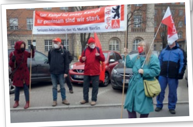
Impressionen der AGA im IG Metall Bezirk Berlin-Brandenburg-Sachsen