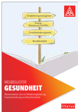
Broschüre DIN A4, Produkt-Nr.40369-92404

Dieser Wegbegleiter bietet einen Überblick über zentrale Fragen des Arbeitslosengeldes: Wie hoch ist das Arbeitslosengeld I? Wie wird es beantragt und wie lange wird es gezahlt? Was ist ein zumutbares Arbeitsangebot und was nicht? Wann treten Sperrzeiten ein?