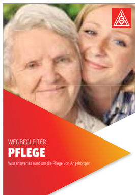
Broschüre DIN A4, Produkt-Nr. 47472-91207

Die IG Metall engagiert sich für sichere Arbeitsplätze, faire Löhne sowie eine gute soziale Absicherung. Sie unterstützt ihre Mitglieder bei Problemen in der Arbeitswelt, aber auch bei weitergehenden Fragen des Lebens. In der Wegbegleiter-Reihe werden Lebens- und Alltagsfragen wie Vorsorge, Rente, Gesundheit oder Pflege aufgegriffen. Die Themen werden übersichtlich aufgearbeitet und Orientierungshilfen gegeben.