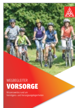
Broschüre DIN A4, Produkt-Nr. 1000158A

Der Wegbegleiter Rente befasst sich mit allen wesentlichen Vorüberlegungen rund um den Renteneinstieg, den vorgezogenen Renteneinstieg und die jeweiligen Abschläge bis hin zum Thema Besteuerung der Rente sowie Unterstützungsleistungen, wenn die Rente nicht ausreicht.