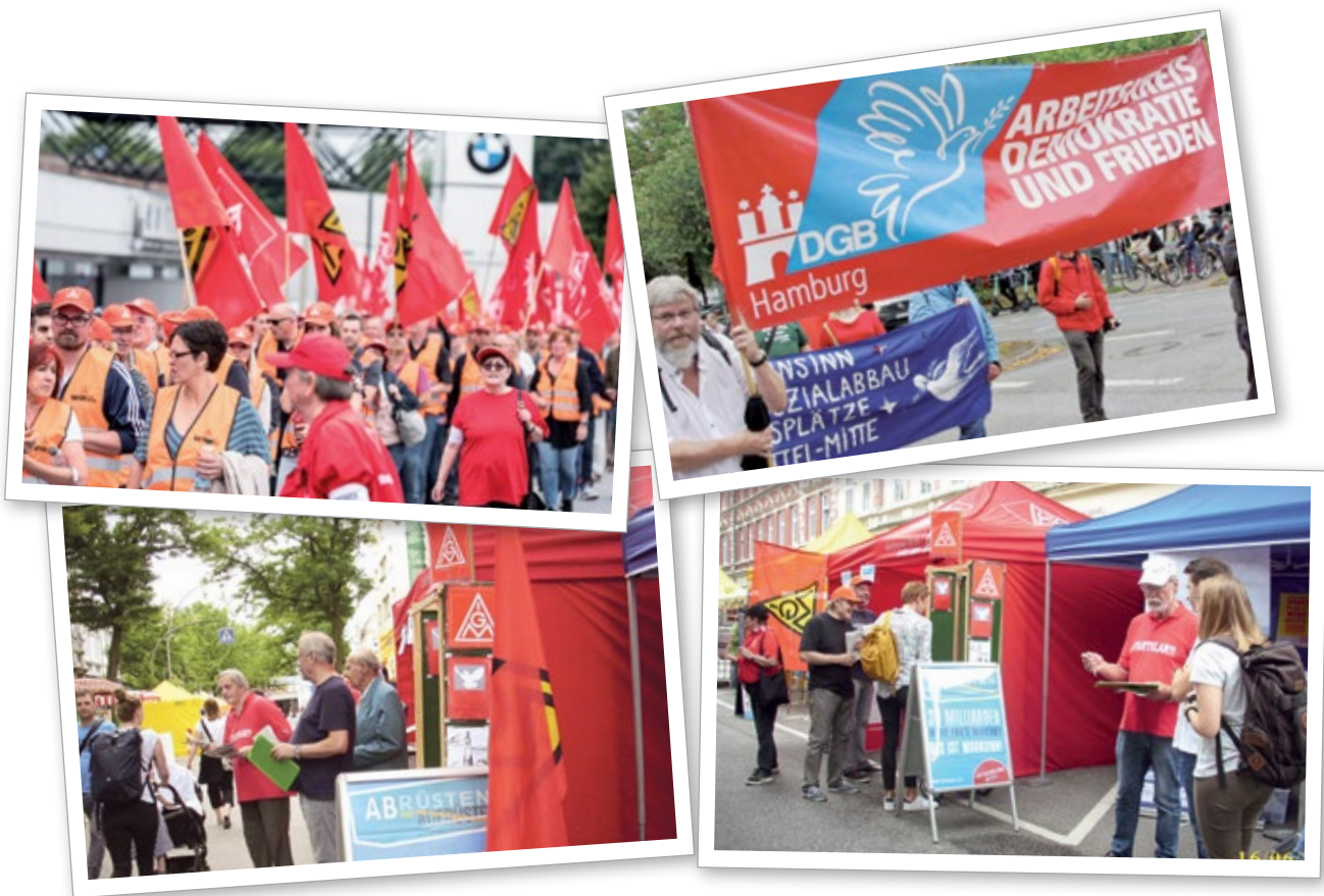
Impressionen der AGA im IG Metall Bezirk Küste

Bündnispartner:innen, wie zum Beispiel dem Sozialverband Deutschland oder dem Verein Dau wat (plattdeutsch für „Tu was“, eine gewerkschaftliche Erwerbslosenvertretung im Raum Rostock). Auch mit Stadtteilinitiativen, Initiativen für Frieden oder gegen rechts wird der Austausch gesucht. In allen fünf Bundesländern der Küste arbeiten die Senior:innen in den Senior:innenbeiräten im Rahmen der jeweiligen Senior:innenmitwirkungsgesetze mit.